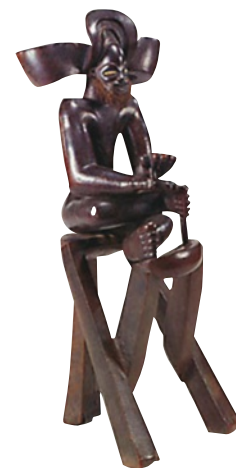
44 Peça de arte lunda