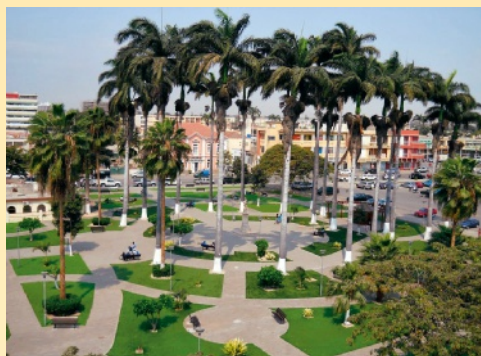
A Jardim de Benguela, actualidade