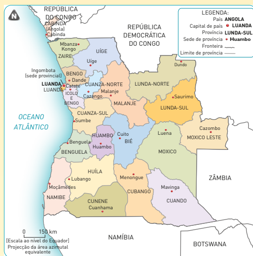
B Mapa político de Angola