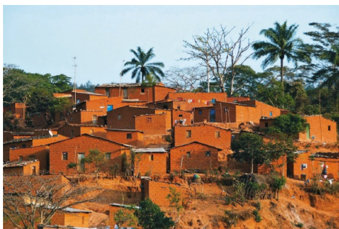
10 Província do Cuanza-Sul (Angola). Libolo é um dos seus municípios, assim como Quibala, Mussende, Amboim, entre outros

Estes encontravam-se pouco unidos e só mais tarde, a partir de 1590, quando tomaram consciência de que juntos poderiam vencer os invasores portugueses, formaram uma coligação . Tratou-se da 1. a Coligação composta por alguns Estados da região (como o Ndongo e a Matamba), para além do Kongo, pelos Jagas e por escravos