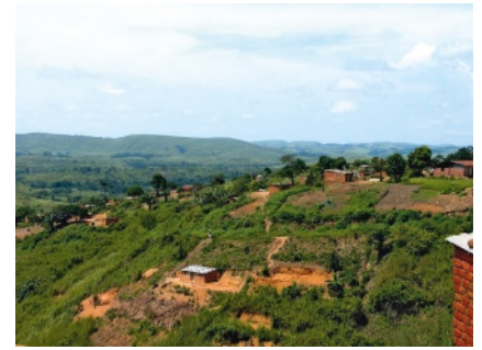
31 Mbanza Kongo, actualidade

Este império é constituído por vários grupos, designados por Lunda-Cokwé ou, simplesmente, por Valunda ou Vacokwé e deu origem ao terceiro grande grupo etnolinguístico de Angola, composto por subgrupos como os Balunda, os Lunda-Ndembu, os Vacokwé.