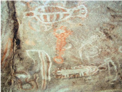
1 Estação arqueológica de Tchitundo-hulo (Angola)

Estudos arqueológicos realizados no país referem que as primeiras comunidades humanas habitaram várias regiões do território angolano. Os vestígios pertencentes aos povos mais antigos de Angola foram encontrados em várias estações arqueológicas do país, entre elas, a de Benfica , em Luanda; a de Tchitundo-hulo , no Namibe, e, no Kwandu Kubango, a do Kwanger .