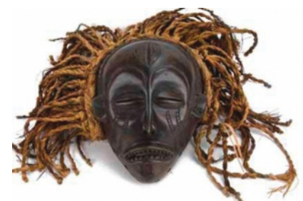
34 Arte Cokwé