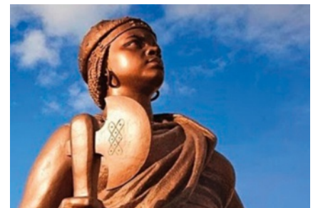
33 Estátua de Njinga Mbandi, rainha dos reinos do Ndongo e de Matamba no século XVII