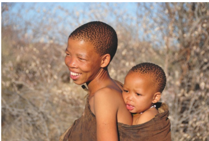
21 Mulher e Criança khoi-san, actualidade

Em relação aos traços somáticos , os povos pré-Bantu apresentavam pele castanho-clara, cabelos encaracolados e olhos rasgados (do tipo oriental). Além disso, disseminados por tribos numerosas, viviam em comunidades primitivas lideradas por um chefe escolhido entre os membros da tribo, adoptando um particular modo de vida .