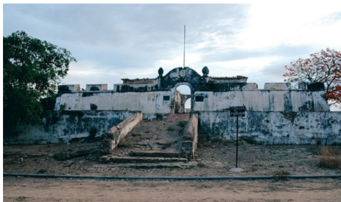
9 Fortaleza de Massangano, actualidade

Tais acções instalaram o terror e o medo no seio das populações e das autoridades da Kissama (Quiçama) e, por isso, muitos habitantes locais recusavam combater e outros aliavam-se aos portugueses. Os Estados derrotados foram mesmo obrigados a pagar impostos em escravos. Ainda assim, a luta continuou durante cerca de duas centenas de anos, já que havia ainda outros sobados que venceram o medo e, mesmo derrotados, nunca se entregaram e continuaram a sua luta.