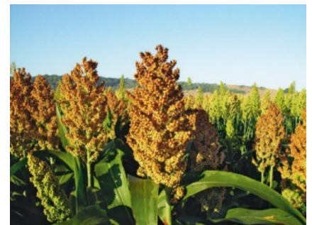
43 O cultivo de massango e massambala