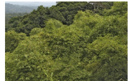
32 Floresta de Maiombe (Angola)