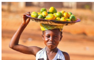
7 Trabalho infantil.

O consumo é igualmente um acto social, na medida em que as escolhas dos consumidores podem ser benéficas ou prejudiciais para as pessoas, as sociedades e o Mundo.