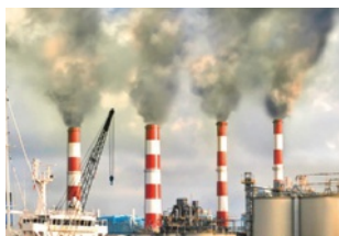
6 Poluição industrial.